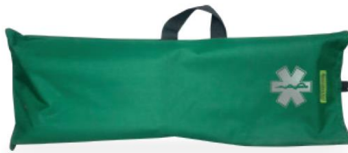
Bolso de Transporte